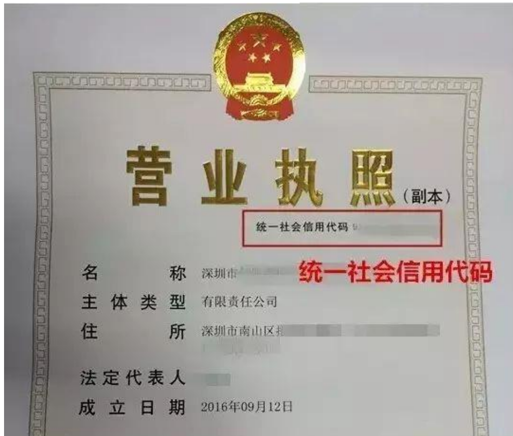
统一社会信用代码