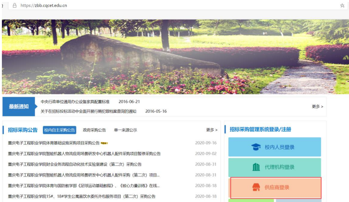
招标采购管理系统登录入口